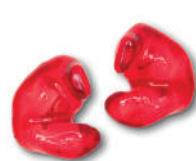
OTO21 CLASSIC SNR 21 (H 24 - M 18 - L 16)