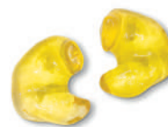
OTO23 MIX SNR 23 (H 27 - M 19 - L 14)